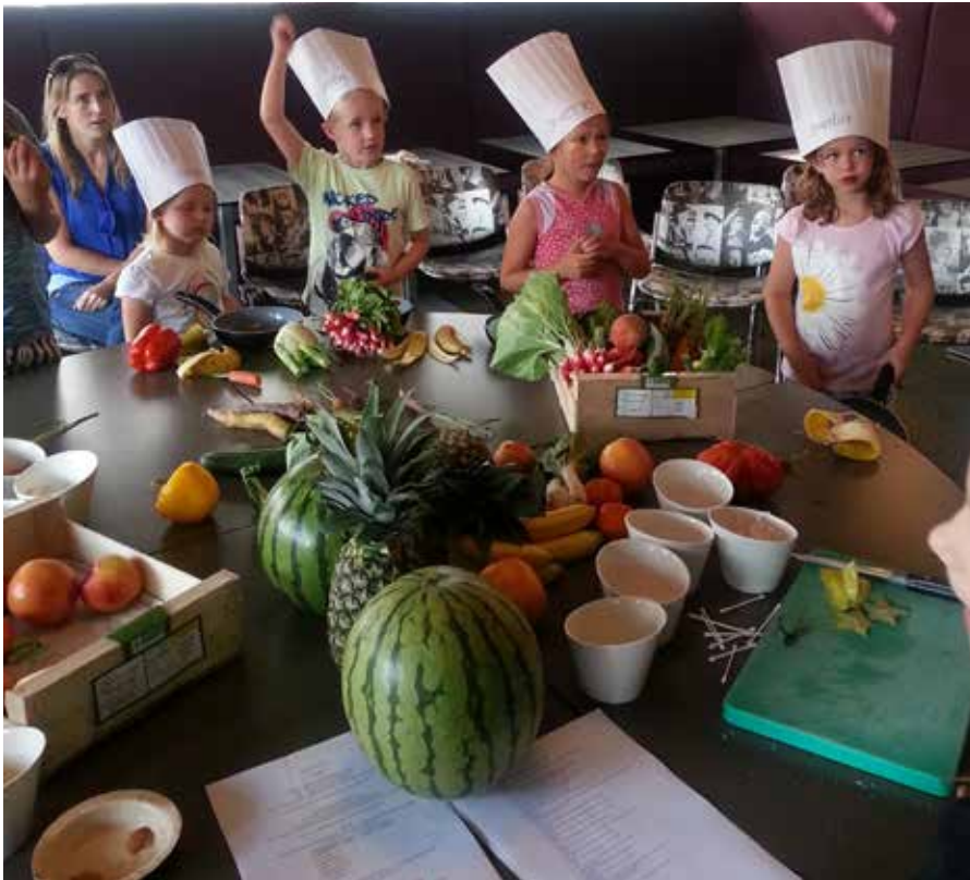
Kunst & Kids - WORKSHOP FARA MORGANA

De financiering kwam mede tot stand dankzij bijdragen van de gemeente, Stichting Stinak, het Prins Bernhard Cultuurfonds, de (Huis)Vrienden van de schouwburg en, heel bijzonder, het Rabobank Coöperatief Fonds, waar het Huiskamerfestival een van de genomineerden én winnaars van de bijbehorende verkiezingen was.