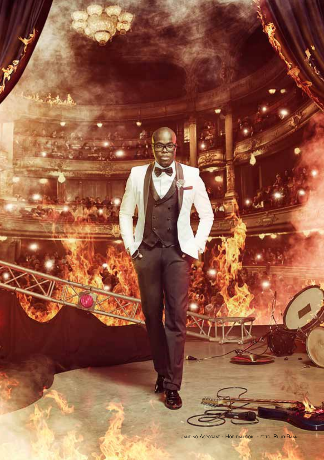
JANDINO ASPORAAT - HOE DAN OOK - FOTO: RUUD BAAN