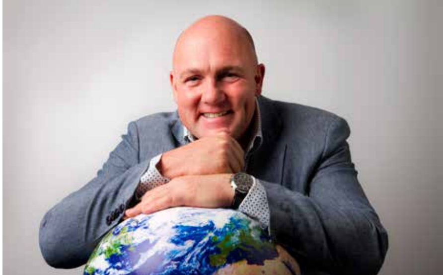
ANDRÉ KUIPERS - RUIMTEWAARTCOLLEGE

een onderzoek gedaan naar hun voorkeuren. Hieruit bleek onder meer dat maar liefst 73% van de operabezoekers nog niet eerder een operafilmvertoning had bezocht, maar dit graag een keer zou doen. Voor ballet lag dit percentage zelfs op 86%.