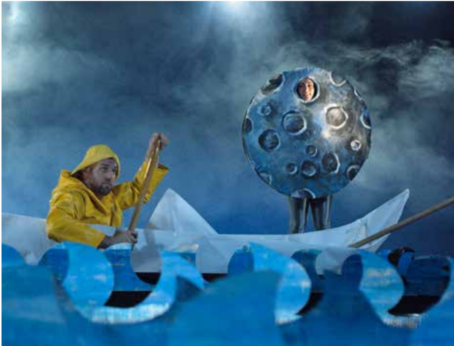
HET GREZELKABINET