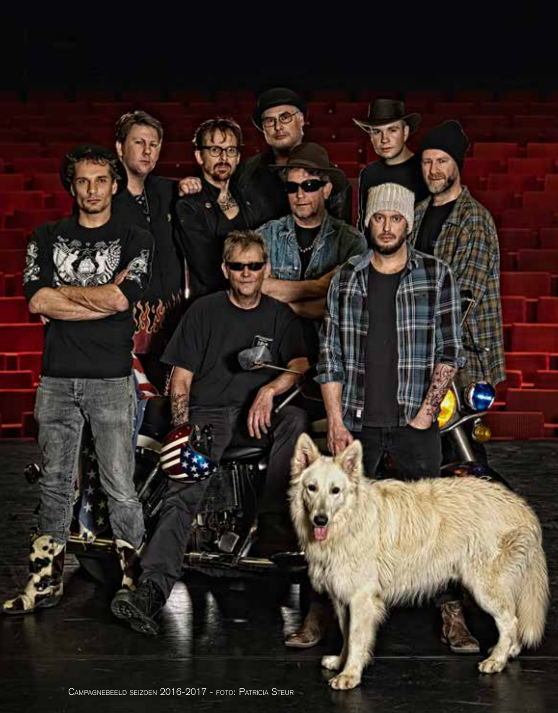
CAMPAGNEBEELD SEIZOEN 2016-2017