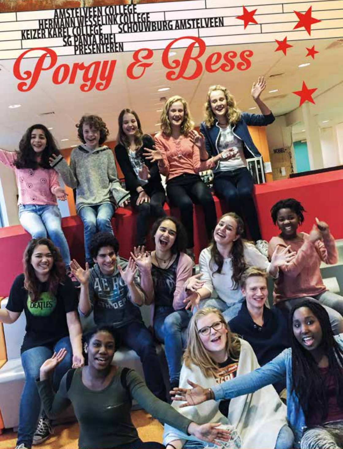
SCHOLENMUSICAL PORGY & BESS