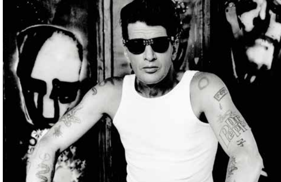
CHEZ BROOD

receptie in de schouwburg. Tijdens het festival was er onder meer een besloten vertoning voor de dames van CIA (Collectieve Israël Actie) en drie films hadden na afloop een Q&A met een actrice of regisseur.