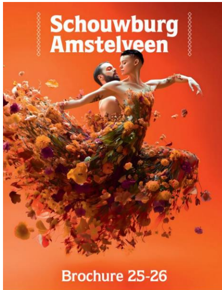
Voorzijde seizoensbrochure 25/26

Na een recordaantal bezoekers in 2024 wist het publiek ons ook afgelopen jaar weer in groten getale te vinden. Voor het eerst werd daarbij de mijlpaal van meer dan 200.000 bezoekers bereikt. Daar zijn we natuurlijk ontzettend trots op. Uit het continue publieksonderzoek blijkt dat Schouwburg Amstelveen met een 8,4 wordt beoordeeld; een mooi resultaat dat met het oog op de grootschalige verbouwing alleen nog maar beter kan worden.