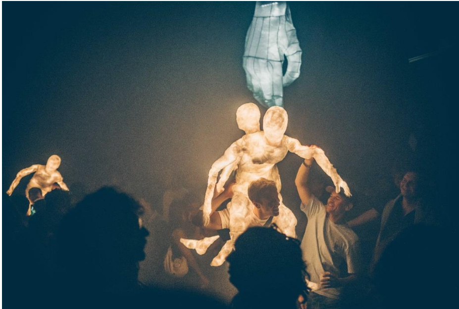
Alice in Thunderland