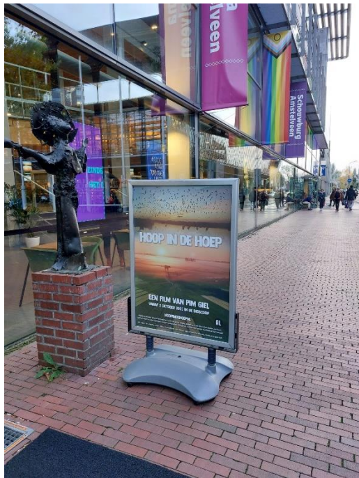
Filmposter van Hoop in de Hoep

De maandelijks MovieNight in De Landing is na een pilot van 6 maanden gestopt. Helaas was er te weinig animo voor de vertoningen. Er wordt nagedacht over een ander filmplan.