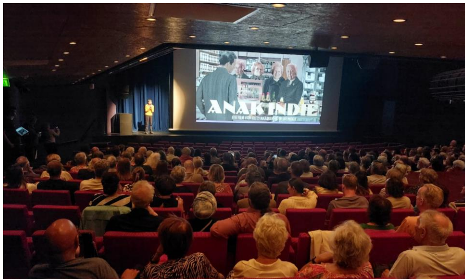
Voorpremière Anak Indië

Ook waren er 6 inleidingen en nagesprekken met bijzondere personen, waaronder met regisseur Hetty Naaijkens–Retel Helmrich bij de voorpremière van Anak Indië . Voorafgaand de documentaire Een Vrouw Als Monique verzorgde Rudi de Boer op 28 september een oeuvrelezing over de Grande Dame van de Nederlandse film; Monique van de Ven. Ter afsluiting van de vertoning was Monique zelf aanwezig voor een nagesprek in een uitverkochte Grote Zaal.