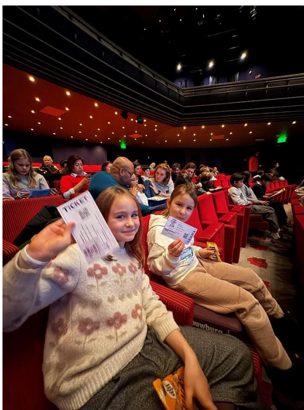
Alle Kinderen Naar Theater

Ook Cinema Amstelveen ontving in 2025 diverse aanvragen vanuit middelbare scholen. Zo bezochten leerlingen van de basisscholen Samen Een, De Westwijzer en 't Startnest uit Uithoorn Raar maar Waar uit de Eye Korte Film Poule. Raar maar Waar is een compilatie van bijzondere korte films die leerlingen in een filmzaal bekijken met een inhoudelijke voorbereiding en verwerking op school. Met dit programma worden leerlingen uitgedaagd op de films te reflecteren, hun mening te verwoorden en te onderbouwen en te luisteren naar andermans mening. In totaal zijn er 16 filmvertoningen geweest met 1.198 bezoekers in het kader van cultuureducatie.