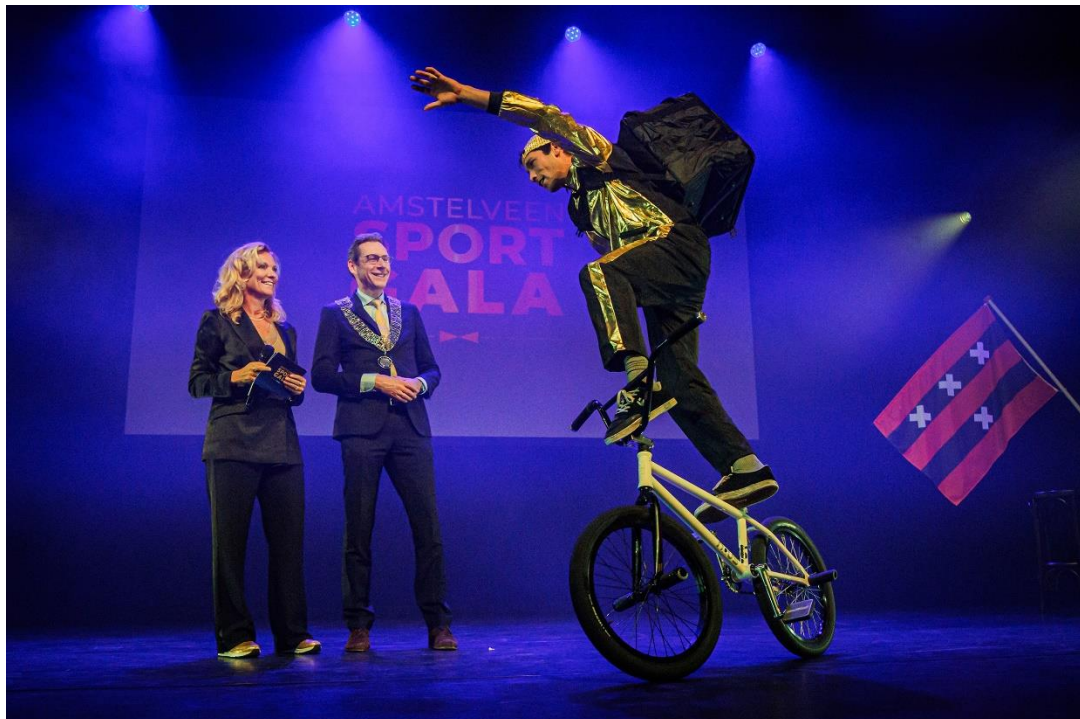
Amstelveen Sport Gala