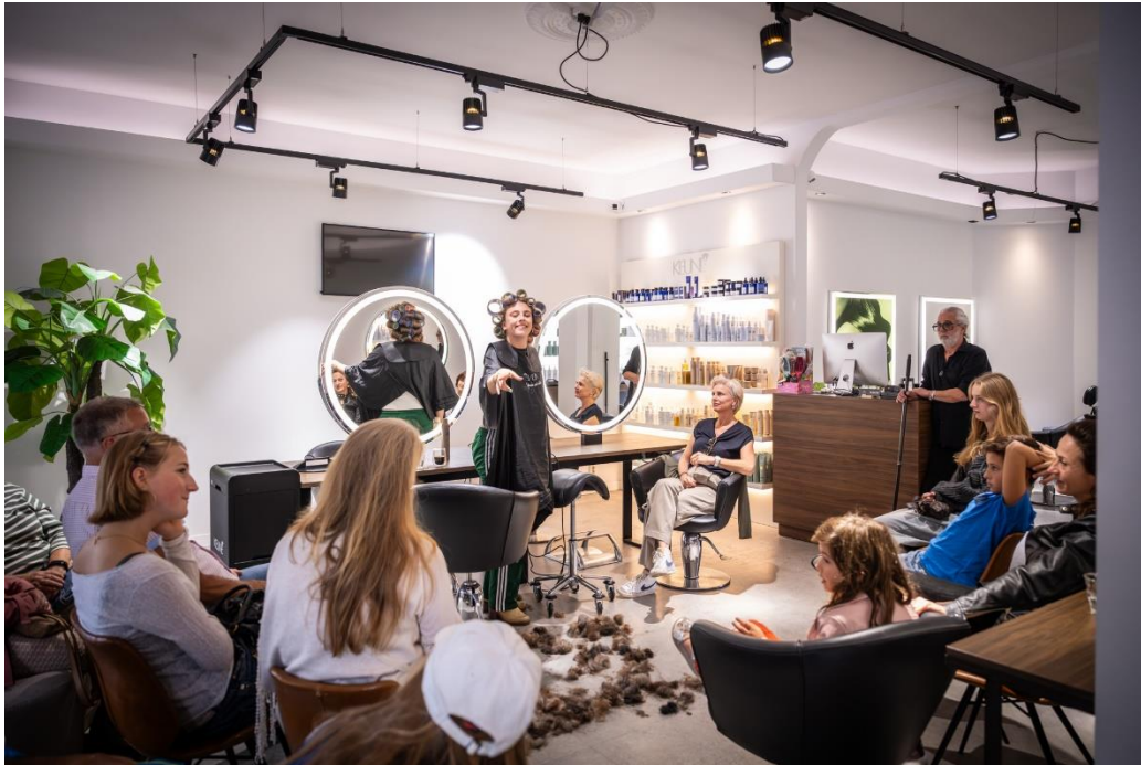
Verhalenparade op locatie bij De Kapper

In het tweede weekend van september streek onze Verhalenparade neer in het Oude Dorp. Op diverse locaties kon men luisteren naar korte monologen gebaseerd op de vakantie verhalen van Amstelveners, met verve gespeeld door vier jonge acteurs.