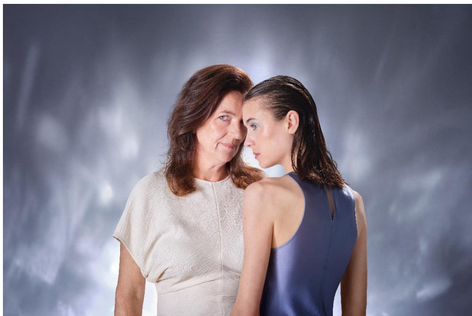
Toneelstuk Phaedra in vlammen