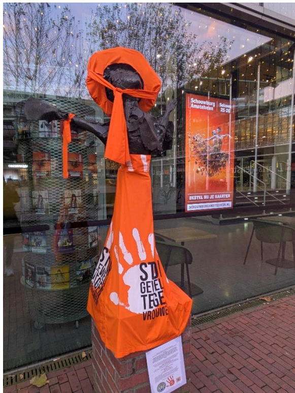
De dankbare actrice

Als een kind opgenomen wordt in een ziekenhuis is dat niet niks. Weg zijn van huis en de vertrouwde omgeving zorgt voor veel spanning en stress bij zowel kind als ouder. Samen met het Emma Kinderziekenhuis bieden wij ouders die het hard nodig hebben een ouderverwenmoment aan. Het stelt hen in staat om even op adem te komen en te genieten, waardoor zij er vervolgens met hernieuwde energie kunnen zijn voor hun kinderen. Een reactie van een blije moeder: 'Afgelopen donderdag ben ik naar de theatervoorstelling in Schouwburg Amstelveen geweest, samen met vriendin wier zoon ook patiënt is in het AMC. We hebben ontzettend genoten van de geweldige musical en willen jullie bij deze hiervoor bedanken!'