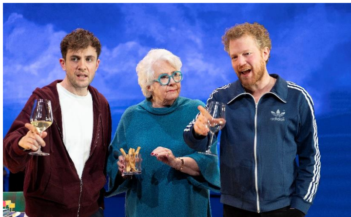
Galerie The Waverly

In het seizoen 2022/2023 introduceerden we de Amstelveense Toneel Publieksprijs met als doel toneel op een positieve manier onder de aandacht van het publiek te blijven brengen. Na afloop van alle toneelvoorstellingen nodigden we daarom de bezoekers uit om hun stem uit te brengen.