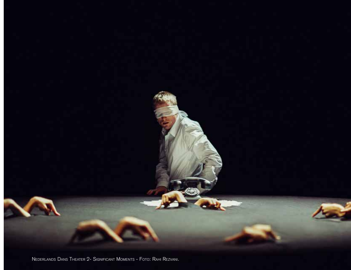
NEDERLANDS DANS THEATER 2- SIGNIFICANT MOMENTS - FOTO: RAHI REZVANI.

De belangrijkste onderwerpen in de raad waren de programmering, de jaarrekening 2017, het beleidsplan, de begroting 2019, de verbouwing van de Filmzaal, de upgrade van de Kleine Zaal, de Algemene Verordening Gegevensbescherming, het horecabeleid, het filmbeleid, de speerpunten m.b.t. de marketing alsmede nieuwe ontwikkelingen inzake de toekomst van het Stadshart en de rol die de culturele instellingen op het Stadsplein van de gemeente Amstelveen daarin kunnen spelen. De schouwburg had te maken met de tweede tranche van een door de gemeente Amstelveen opgelegde verlaging van de subsidie. Wij hebben veel waardering voor het feit dat directeur en managementteam van de schouwburg wederom daadkrachtig en op positieve wijze hebben gereageerd op de opgelegde bezuiniging met de nadruk op cultureel ondernemerschap en het benutten van kansen.