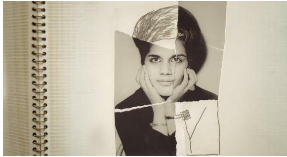
Best of IDFA on tour - Radiograph of a family (VS)