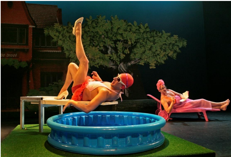
Lang en Gelukkig (8+)

Nieuw publiek trekken is één ding, maar bestaande bezoekers behouden is nog veel belangrijker. Hun ervaringen bepalen in sterke mate hoe de buitenwereld over ons denkt. Dat klagers bovendien de moeite nemen om slechte ervaringen met ons te delen, beschouwen we dan ook als een kans: voor uitleg, herstel én verbetering. In 2014 zijn op het totaal van ruim 114.000 bezoekers 51 klachten binnengekomen en naar tevredenheid afgehandeld.