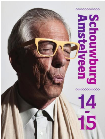
Omslag brochure 14/15: 'Willem', door Jennifer Muller

Het seizoen gaat in de schouwburg altijd van start met de publicatie van de seizoensbrochure, nog altijd het belangrijkste communicatiemiddel rond de programmering. Eind april viel de brochure bij bijna 7.000 trouwe klanten op de mat en stond als blader-pdf op de website. In aanloop naar de start voorverkoop op 10 mei was er een uitgebreide publiekscampagne via buitenreclame, e-mailmarketing, sociale media en free publicity in de lokale media. Dit jaar vond voor het eerst ook een nabelactie plaats onder vroegboekers van eerdere seizoenen: een vorm van retentiemarketing om vaste klanten te behouden en te stimuleren.